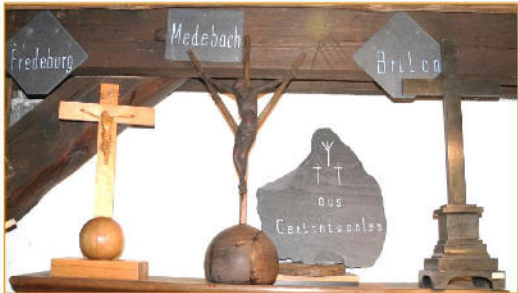
Kreuze aus Gerichtssälen